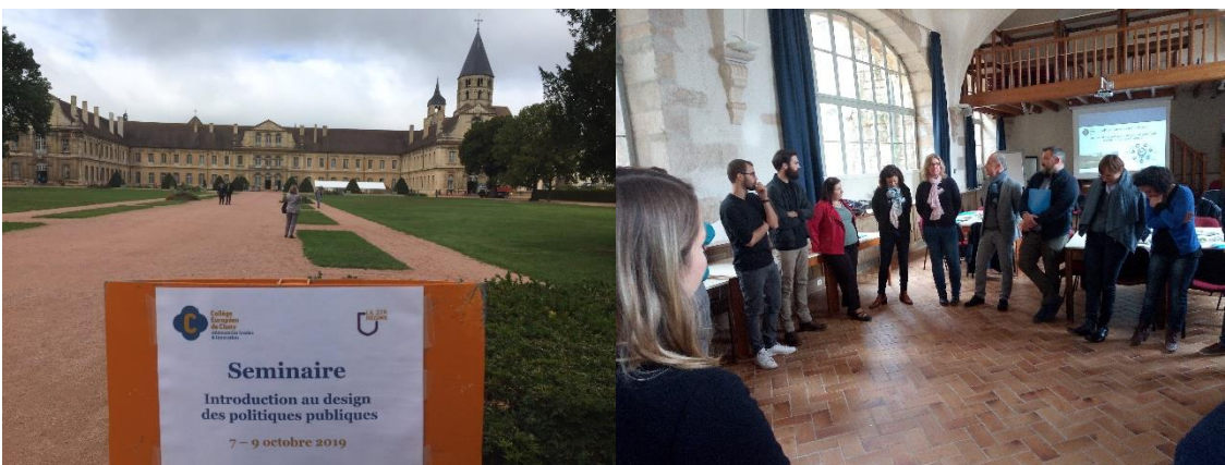
Accueil des participants